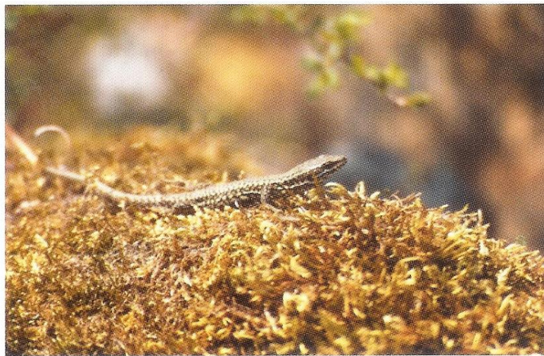
Podarcis muralis , man

In de Fondry des Chiens kwamen zeer veel muurhagedissen voor, ondanks de vele langslopende wandelaars. De dieren waren niet al te schuw en wanneer je er even voor ging zitten waren ze goed