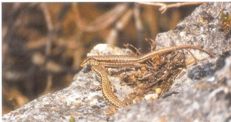
Podarcis muralis , man en vrouw

J. ter Borg Nieuwemeerdijk 253 1171 NP Badhoevedorp