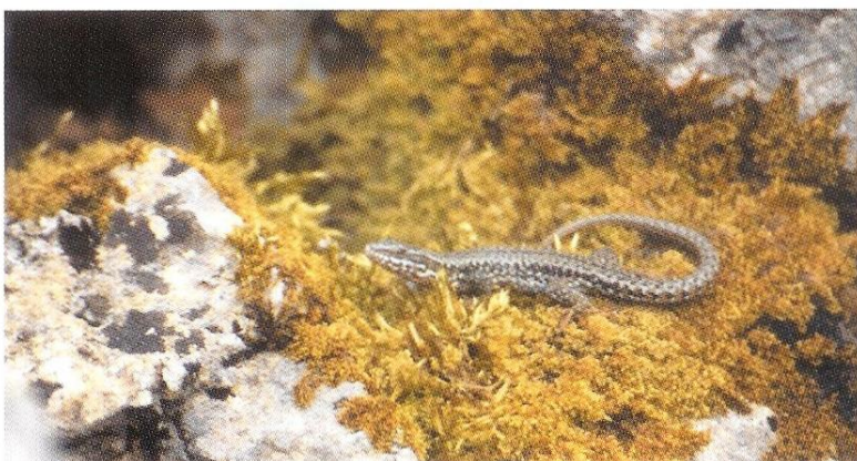
Podarcis muralis , man

De meest bekende Abannet in de streek is de Fondry des Chiens. Deze heeft afmetingen van ongeveer 20 bij 30 meter en een diepte van ongeveer 10 meter. De wanden bestaan grotendeels uit fossielhoudende kalksteen, er is een spaarzame begroeiing van struikjes en gras. Hier en daar ligt wat afval. De directe omgeving is open grasland. De zon kan volop in de kloof doordringen.