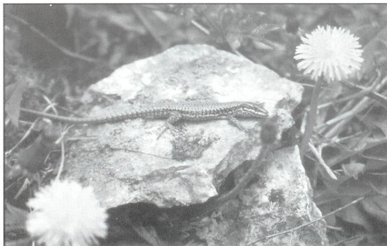
Podarcis muralis , man

Probably an Abannet, being sheltered from wind, is an extra suitable habitat for wall-lizards, especially in the northern parts range of distribution.