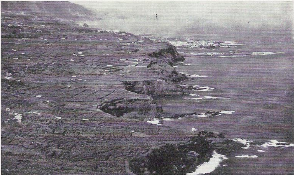
De Canarische eilanden, woongebied van de grote, donkergekleurde hagedissen.

het waterbakje hadden ze helemaal geen belangstelling en het „verzandde” door hun grote wandel- en graafactiviteiten spoedig geheel. Na verwijdering van hun soortvreemde compagnons werden de simonyi 's weer aanmerkelijk schuwer en hielden zij zich meestal weer verborgen, maar bleven regelmatig eten, waarbij de jongere dieren, zoals zo vaak voorkomt, de grootste driest-