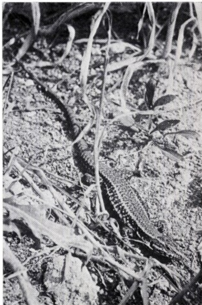
Lacerta muralis muralis Laurenti

Het is moeilijk zich aan de indruk te onttrekken, dat deze opschoning – bedoeld als „enige voorbereidende werkzaamheden voor het herstel van de muren en bastions” – de gemeente Maastricht wel te pas kwam in verband met haar plannen om deze Staatseigendommen meer dan tot nu toe voor recreatieve doeleinden bruikbaar te maken.