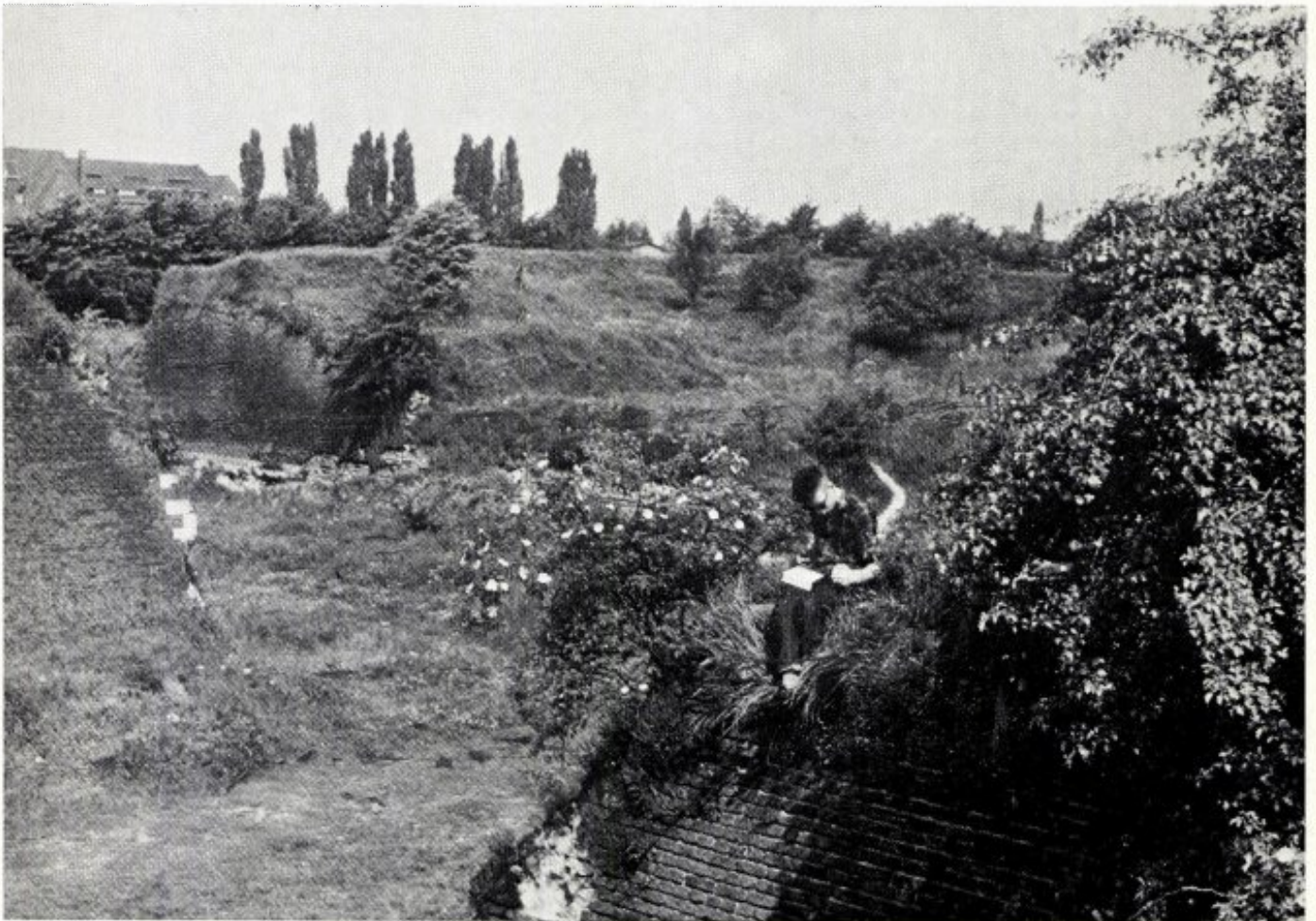
De „Hoge Fronten” te Maastricht voor het opschonen.

Teneinde de natuurbeschermingsbelangen beter veilig te stellen heeft daarna de Inspecteur der Domeinen Zuidoost Nederland aan de gemeente Maastricht voorgesteld een deskundige van het Staatsbosbeheer in de „Commissie Hoge Fronten” op te nemen en als zodanig werd ik voorgedragen. Met genoeg