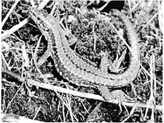
Abb. 2. Männchen von Podarcis muralis in der Bielefelder Population.