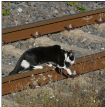
Abb.41: Hauskatze auf der Jagd, nahe St-B, 10.10.2021