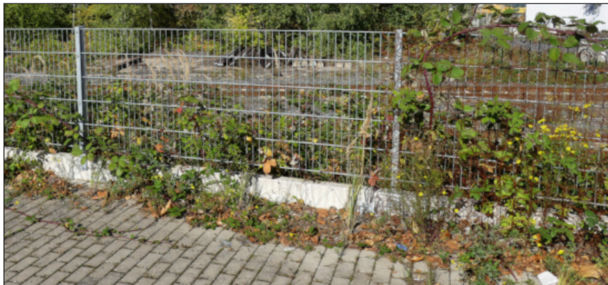
Abb.15: Standort B = St-B, Woll- marktstr., von hier wur- den zunächst Beobach- tungen über den Zaun in das Bahngelände ge- macht; später kamen Sichtungen unmittelbar am Bürgersteig-Rand und auf dem Zaunsockel dazu, 09.10.2021