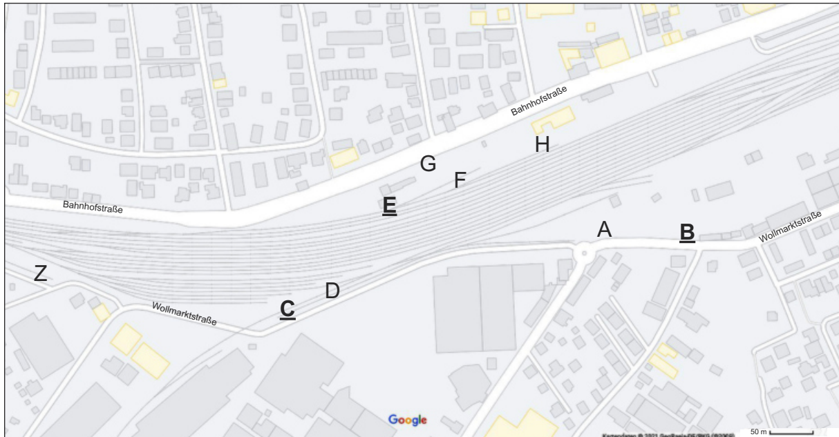
Abb.36: Bahngelände, westlich vom Hauptbahnhof, Standorte (St): A bis H = Mauereidechsen; Z = Zauneidechse bisherige Hauptbeobachtungsstandorte: B , C und E

Schaut man sich die Übersicht der bisherigen Fundorte an (Abb.36), so lässt sich vermuten, dass Mauereidechsen im gesamten Bereich des Bahngeländes im größeren Umfeld des Hauptbahnhofes Paderborns vorkommen. Zumindest lässt sich das für alle geeigneten Stellen in den Randbereichen des Geländes vermuten. Aufgrund der recht weiträumigen Nachweise ist davon auszugehen, dass diese Vorkommen schon seit längerer Zeit bestehen. Auch Bemerkungen eines Lokführers, der mit Rangierarbeiten in dem Gebiet betraut ist, und die eines sogenannten „trainspotters“, der Züge fotografiert, lassen dies vermuten. Für beide war das Vorkommen von Eidechsen im hiesigen Bahngelände nichts Neues.