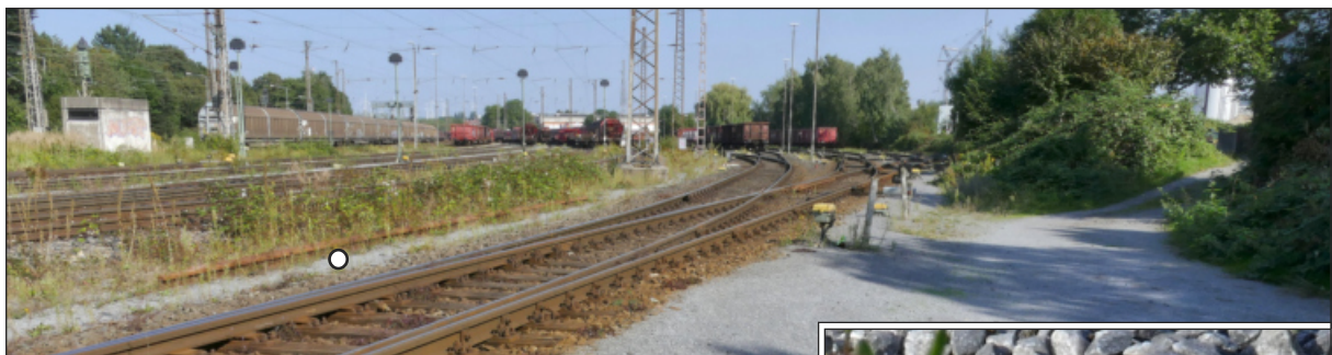
Abb.45 (oben): St-Z, die Stelle, an der die junge Zauneidechse mit Hilfe von Fernglas und Teleobjektiv gesichtet wurde, ist mit einem Kreis gekennzeichnet, 05.09.2021

In diesem Zusammenhang ist eine Einzelbeobachtung einer jungen Zauneidechse im Paderborner Bahngelände von Bedeutung, die zeigt, dass Zauneidechsen offensichtlich in gleichen oder benachbarten Bereichen wie die eingeschleppten Mauereidechsen vorkommen (Abb.45+46). Dass bislang in unmittelbarer Nähe dieses zunächst einzigen Zauneidechsen-Fundortes (St-Z, siehe Abb.36) von uns noch keine Mauereidechsen gesichtet wurden, kann damit zusammenhängen, dass in diesem Bereich die Beobachtungsmöglichkeiten, wegen des häufigen Rangierverkehrs, nicht sehr günstig sind. Die Sichtung des winzigen Zauneidechsen Jungtieres war insofern wohl auch ein außergewöhnlicher Zufall.