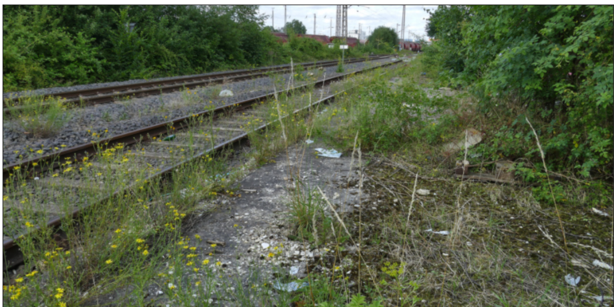
Abb.2: Hier begannen die Beobachtungen, Bahngelände an der Wollmarktstraße, St-C, 18.07.2021, das vordere Gleis endet links, nach wenigen Metern, bei einem Prellbock

Am 18.07.2021 wurden zufällig zwei Mauereidechsen am Rande der Wollmarktstraße in Paderborn beobachtet. Im schmalen Bereich zwischen Straße und wenig genutzten Bahngleisen wachsen Büsche (Brombeeren u.a.) sowie Gräser, verschiedene Stauden und Kräuter; auch finden sich dort manche unschöne Müllablagerungen (Abb.2: Standort C = St-C, siehe auch Abb.36). Die scheuen Tiere konnten beim Sonnen und bei der Nahrungssuche beobachtet werden und hielten sich sowohl auf dem befestigten Randbereich (Beton), auf den Resten einer abgelagerten Holz-Palette (Abb.2, rechts im Bild) und im Gleisbett des vorderen Schienenstranges und dahinter auf.