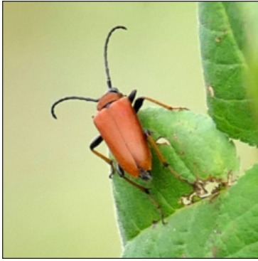
Abb.37: Bockkäfer, St-C, 13.08.2021