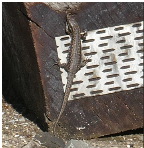
Abb.18: Mauereidechse, auf abgelagerter Bahnschwelle (weit entfernt), St-B, 24.10.2021