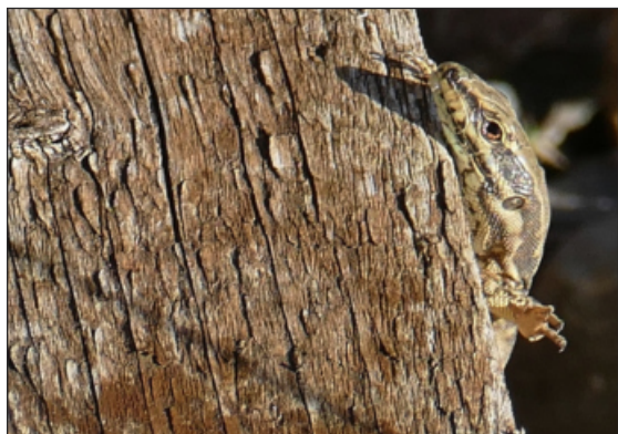
Abb.30+31: Mauereidechsen, St-E, Bahnhofstr. auf altem Vierkantholz im Gleisbett, vor der Rampen-Wand, 24.10.2021