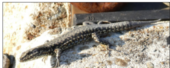
Abb.13: Mauereidechse. St-B, 04.09.2021

Und am gleichen Tag ergab sich dann auch der erste Nachweis am Standort B (St-B, siehe Abb.36, 14), nochmals etwa 50 m weiter nach Westen. St-B erwies sich in der Folgezeit als besonders günstige Beobachtungsstelle. Direkt gegenüber dem Gelände der Johanniter-Unfallhilfe gelegen, weist der Bürgersteig hier eine Art