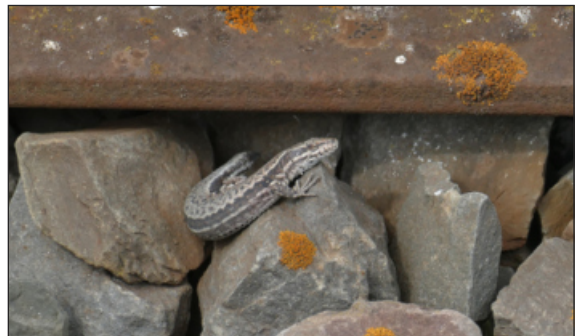
Abb.6: Mauereidechse (= Abb.5), St-C, 22.08.2021