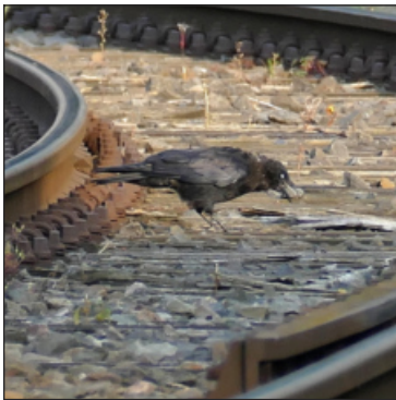
Abb.40: Krähe auf Nahrungs- suche, nahe St-Z, 09.09.2021