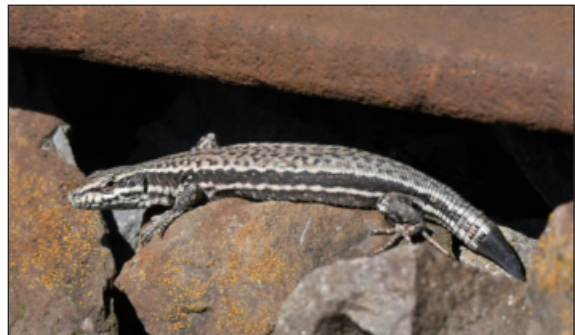
Abb.8: Mauereidechse, St-C, 04.09.2021 gleiches Tier, wie in Abb.6; inzwischen gekürz- ter Schwanz (Autotomie)