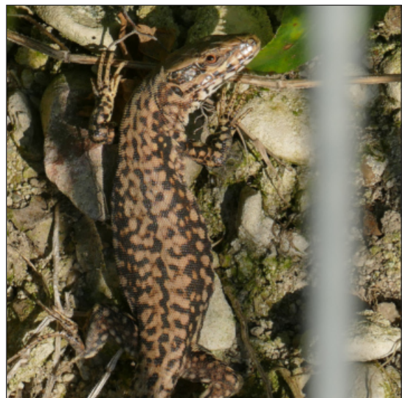
Abb.35: Mauereidechse, St-G, Bahnhofstr., 10.10.2021

Innerhalb unseres relativ kurzen Beobachtungszeitraumes vom 18.07.2021 bis Ende Oktober, also innerhalb von 3,5 Monaten, konnten für die bisherigen Standorte folgende Beobachtungszahlen von Mauereidechsen-Individuen festgestellt werden: