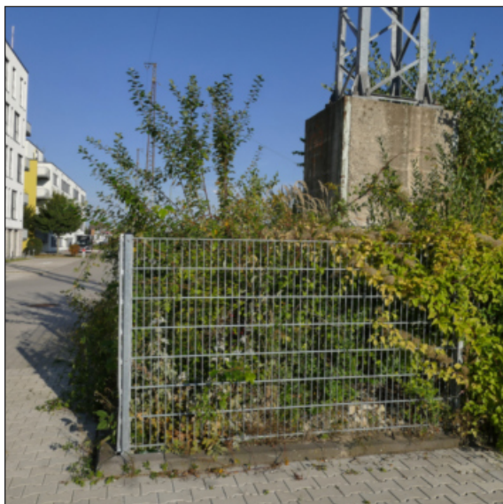
Abb.34: St-G, Bahnhofstr., 10.10.2021