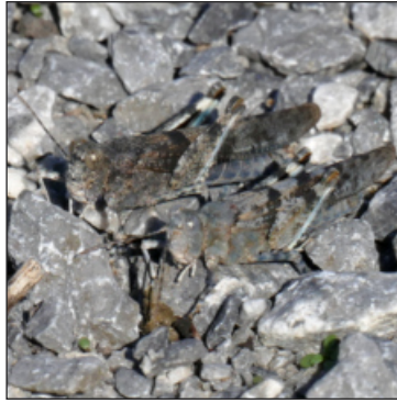
Abb.38: Blauflügelige Sand- schrecken, St-Z, 05.09.2021