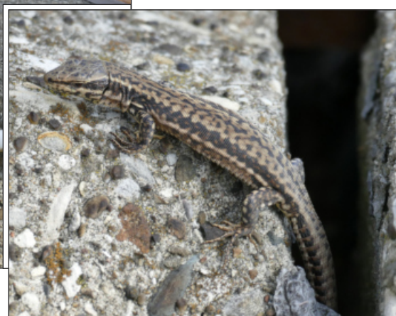
Abb.28+29: Mauereidechse (Pfeil), St-E, Bahnhofstr., 26.09.2021