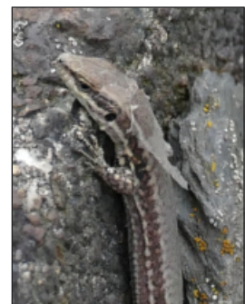
Abb.10 + 11: Mauereidechsen, Jungtiere, St-C, links: 04.09.2021; rechts: 18.09.2021 (Häutung)