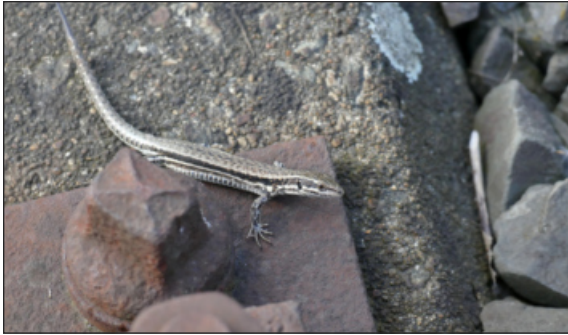
Abb.3: Mauereidechse, St-C, 18.07.2021