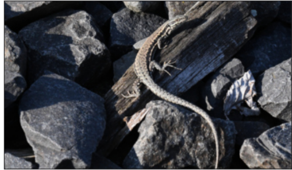
Abb.4: Mauereidechse, St-C, 04.09.2021