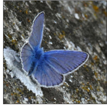
Abb.39: Bläuling, St-E, 26.09.2021