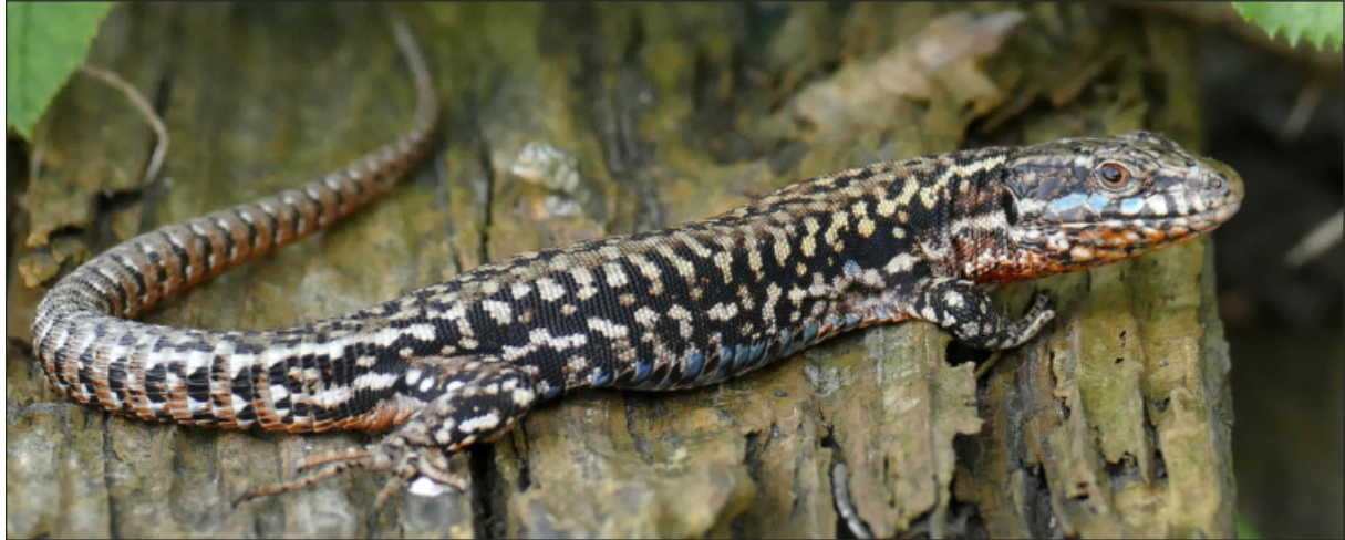
Abb.1: Mauereidechse auf den Resten einer Holzpalette, St-C, Wollmarktstraße, 18.07.2021