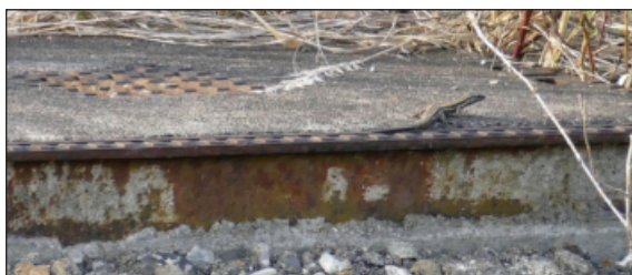
Abb.16: Mauereidechse, auf Schachtdeckel (weit entfernt), St-B, 09.09.2021,