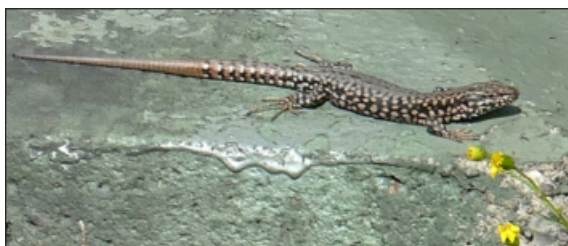
Abb.17: Mauereidechse, auf Betonsockel (weit entfernt), St-B, 18.09.2021