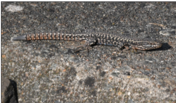
Abb.7: Mauereidechse, St-C, 04.09.2021 gleiches Tier, wie in Abb.1; inzwischen gekürz- ter Schwanz (Autotomie)