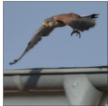
Abb.42: Turmfalke mit erbeu- teter Eidechse, nahe St-B, 22.09.2021

Relativ häufig konnten Mauereidechsen beobachtet werden, deren Schwänze deutlich verkürzt waren (z.B. Abb.7,8,13,23,43). Dies beruht auf der Fähigkeit zur sogenannten Autotomie dieser Reptilien. Bei Gefahr können sie einen Teil ihres Schwanzes blitzschnell abtrennen und auf diese Weise häufig einem Fressfeind entkommen, während dem Feind nur – der noch zuckende – Schwanzteil bleibt. Der Schwanz kann dann bis zu einem gewissen Grade nachgebildet werden (Abb.44). Er bleibt allerdings kürzer und erreicht nicht die ursprüngliche Beweglichkeit, da er statt einzelnen Wirbeln nur einen Knorpelstab als Gerüst beinhaltet.