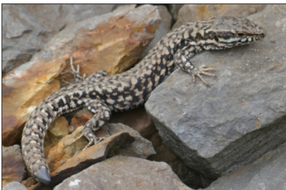
Abb.43+44: Mauereidechse, St-C, links: 22.08.2021, frische Schwanz-Kürzung (Autotomie) rechts: offensichtlich das gleiche Tier mit nachgebildetem Schwanzende, am 23.09.2021

Relativ häufig konnten Mauereidechsen beobachtet werden, deren Schwänze deutlich verkürzt waren (z.B. Abb.7,8,13,23,43). Dies beruht auf der Fähigkeit zur sogenannten Autotomie dieser Reptilien. Bei Gefahr können sie einen Teil ihres Schwanzes blitzschnell abtrennen und auf diese Weise häufig einem Fressfeind entkommen, während dem Feind nur – der noch zuckende – Schwanzteil bleibt. Der Schwanz kann dann bis zu einem gewissen Grade nachgebildet werden (Abb.44). Er bleibt allerdings kürzer und erreicht nicht die ursprüngliche Beweglichkeit, da er statt einzelnen Wirbeln nur einen Knorpelstab als Gerüst beinhaltet.