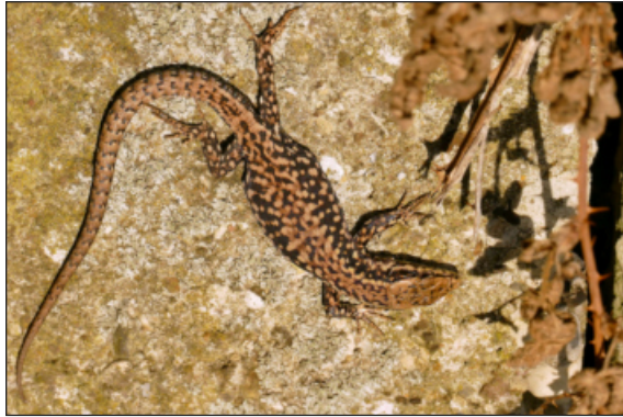
Abb.32: Mauereidechse, St-E, Bahnhofstr. auf der senkrechten Rampenwand, 04.10.2021