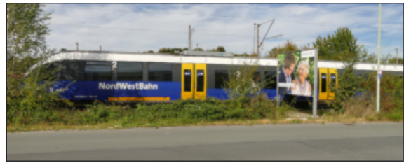
Abb.12: Züge der NordWestBahn fahren regelmäßig auf dem vorderen Gleis bis St-C, manchmal bis zum Prellbock, 01.10.2021

In den folgenden Wochen konnten in diesem Bereich immer wieder Mauereidechsen beobachtet und fotografiert werden. Da die Tiere sehr scheu sind, bedurfte es dazu meist sehr viel Zeit, Geduld und möglichst „Zeitlupenbewegungen“ der Beobachter. Natürlich war es auch sehr von der jeweiligen Witterung abhängig, ob Eidechsen gesichtet werden konnten oder nicht.