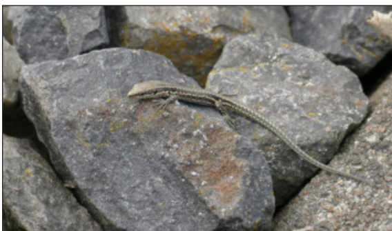
Abb.9: Mauereidechse, Jungtier, St-C, 13.08.2021