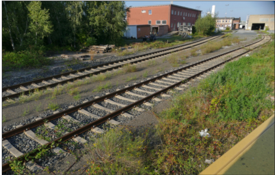
Abb.14: Standort B = St-B, Wollmarktstr., Teil- ansicht, 03.9.2021

Ankunft unbemerkt geflüchtet. Auffallend war, dass die Tiere sich meistens an Stellen aufhielten, von wo sie unmittelbar in Richtung Bahngelände verschwinden konnten.