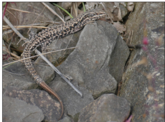
Abb.27: Mauereidechse, St-D, 26.09.2021

Eine Einzelbeobachtung (Abb.27) ergab sich auch noch an der erst kürzlich abgebauten Zug-Tankstelle (Standort D = St-D, siehe Abb.36) ca. 40 m westlich von St-C.