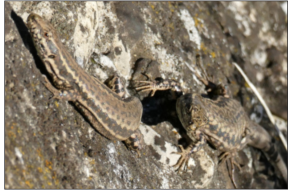
Abb.33: Mauereidechsen, St-E, Bahnhofstr., auf der Rampenwand, neben Mauerspalte, 24.10.2021