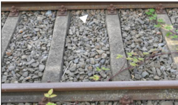
Abb.5: Mauereidechse, St-C, oben Mitte, teils unter der Schiene (Pfeil), 22.08.2021; siehe auch Abb.6