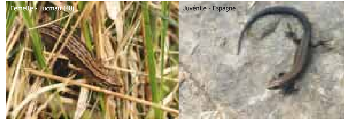
Femelle - Lucmau (40)