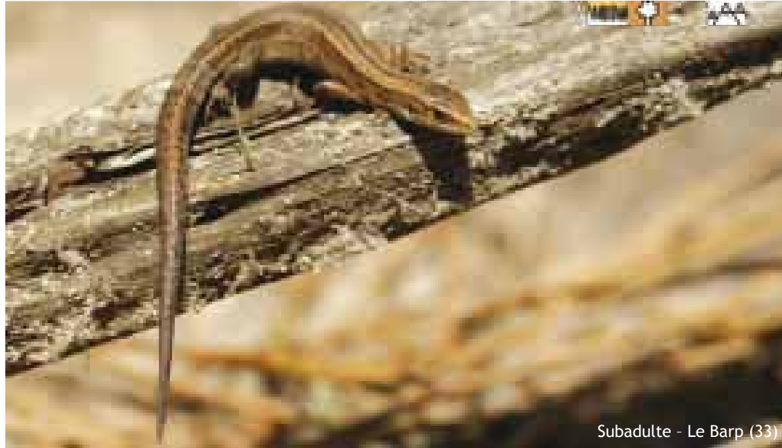
Subadulte - Le Barp (33)