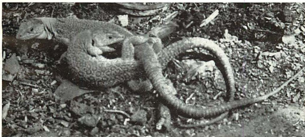
Lacerta lepida in copula

Behalve deze muurgecko's hebben we nog verschillende andere hagedissen, Lacerta-soorten, gevangen. Eerst kregen we een jonge parelhagedis ( Lacerta lepida ) in handen. Onze burens op de camping gaven ons de tip. We hebben hem vlak achter onze tent gevangen op een hellinkje, bezaaid met vuistgrote stenen, waartussen wat lage struikjes stonden. We hebben heel wat van die keien moeten optillen voordat wij hem te pakken hadden. Een paar dagen later vingens wij op nog geen vijf meter