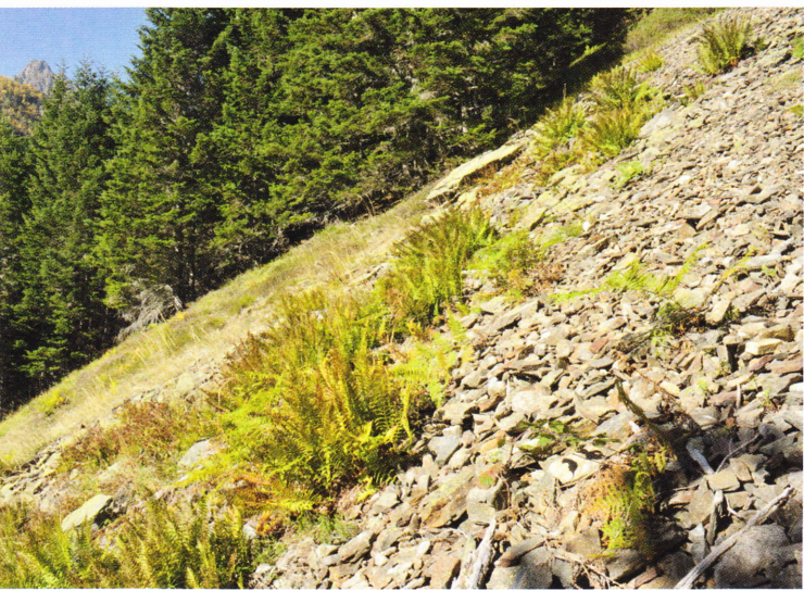
Figure 176: Podarcis muralis , habitat très dégradé (en haut) (le toit est totalement effondré, notamment) à l'étage collinéen subatlantique (Ossen, Hautes-Pyrénées, 510 m, 13 avril 2010). En bas: habitat à l'étage montagnard atlantique (Arrens-Marsous, Hautes-Pyrénées, 1 650 m, 7 octobre 2010).

Ainsi, contrairement aux femelles des populations de plaine qui produisent jusqu'à 3 pontes par an (à La Rochelle: fin avril-début mai, fin mai et fin juin), les femelles des populations de montagne ne produisent qu'une seule ponte annuelle (fin mai-début juin), dont la taille est cependant équivalente à celle observée chez les femelles de plaine (soit 2 à 7 œufs, en général 5 ou 6) (dimensions: 0,7 cm × 1,1 cm) (Saint Girons & Duguy 1970). D'après ces derniers auteurs, cette baisse sensible de la productivité en montagne est imputable aux contraintes de la vitellogenèse, processus réclamant une importante mobilisation des réserves énergétiques. Réserves que la brièveté de la période d'activité annuelle imposée par le milieu montagnard empêche de reconstituer suffisamment (période d'alimentation réduite et chaleur moindre). Selon eux – et dans la mesure où le cycle sexuel des mâles n'est, lui, pas du tout impacté – cette contrainte physiologique joue un rôle majeur dans la limitation altitudinale de l'espèce: « Il est assez probable que, comme chez d'autres Reptiles, la limite altitudinale absolue est due à l'abaissement de la température qui ne permet plus aux embryons de se développer dans le sol. Mais la baisse de fécondité