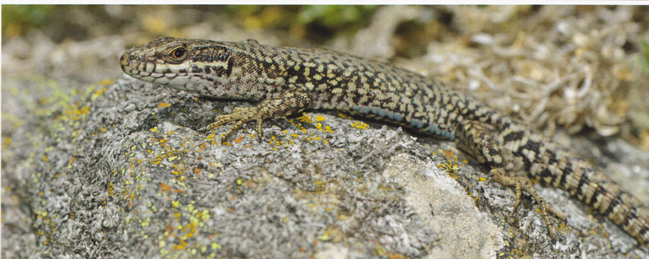
Figure 172: Podarcis muralis , femelle (en haut) et mâle (en bas) d'une population du Capcir (Fontrabiouse, Pyrénées-Orientales, 1 550 m, 29 mai 2011).

Les mâles portent généralement des taches bleu vif sur les écailles ventrales externes, de même que, plus rarement, sur les flancs (voire la tête). D'après Geniez & Cheylan (2012a), ce dernier type de coloration est particulièrement fréquent dans les Pyrénées et le nord-ouest de l'Espagne.