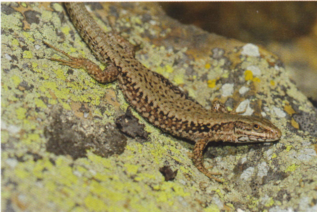
Figure 170: Podarcis muralis , femelle (en haut) et mâle (en bas) d'une population du vallon de l'Iratiko Erréka (Mendive, Pyrénées-Atlantiques, 1 010 m, 9 octobre 2012).