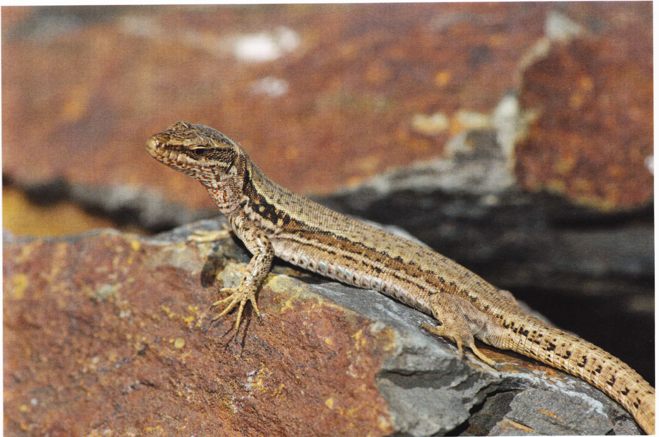
Figure 169: Podarcis muralis , femelle d'une population de la haute vallée de l'Adour (Hautes-Pyrénées, Bagnères-de-Bigorre/Gazost, 2339 m, 18 juillet 2012).