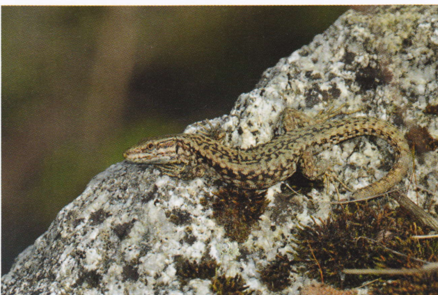
Figure 171: Podarcis muralis , femelle gravide (en haut) et mâle (en bas) d'une population du Vall de Boí (Lérida, 1 170 m, 14 mai 2012).

en zone pyrénéenne, et ne sont pas nécessairement détectables par le phénotype. Inversement, certaines populations présentant une évidente originalité phénotypique ne constituent peut-être pas des unités évolutives : c'est le cas par exemple de P. m. occidentalis Knoepffler & Sochurek in Sochurek, 1956, présent dans l'est des Pyrénées et a priori bien caractérisé par une grande taille associée à une robe très contrastée (lignes dorsolatérales blanches et taches noir pur), notamment cité du lac des Bouillouses (Pyrénées-Orientales) (Geniez & Cheylan 2012a).