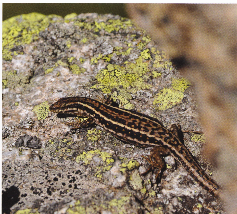
Figure 174 : Podarcis muralis , deux variations extrêmes de la robe en zone pyrénéenne. À gauche, femelle hypochrome du val d'Azun ressemblant superficiellement à Iberolacerta bonnali (Arrens-Marsous, Hautes-Pyrénées, 1 650 m, 7 octobre 2010). À droite, femelle hyperchrome de la haute vallée de l'Ariège affiliable à la sous-espèce P. m. occidentalis (Aston, Ariège, 2 100 m, 26 août 2008).

Dans les Pyrénées, cette espèce est partiellement sympatrique avec les Iberolacerta , qui occupent sensiblement la même niche écologique mais à plus haute altitude (étage alpin). L'étendue verticale de la ceinture de cohabitation potentielle est d'environ 1 000 m et les cas de syntopie ne sont pas rares jusqu'à 2 200 m environ. Les limites altitudinales respectives de P. muralis et des Iberolacerta tiennent vraisemblablement aux caractéristiques physiologiques des espèces concernées et aux inadaptations environnementales qu'elles impliquent, l'un ou l'autre lézard étant contre-sélectionné par diverses variables à un endroit donné (voir « Biologie & phénologie »).