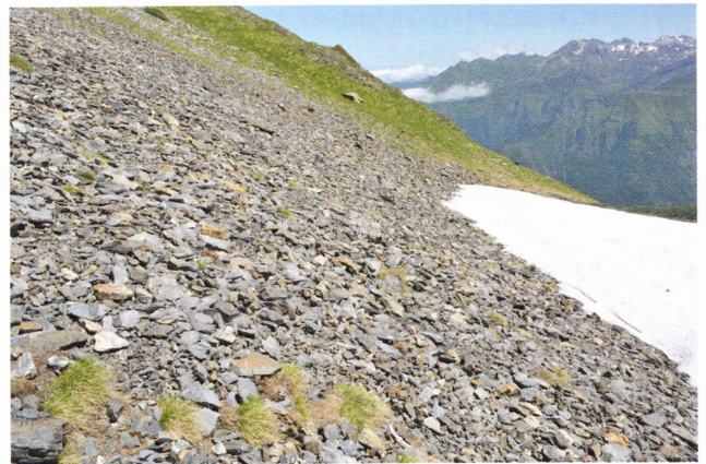
Figure 177: Podarcis muralis , habitat subalpin du vallon d'Arrious à Laruns (Pyrénées-Atlantiques, 1 700 m, 24 juin 2015) (en haut). En bas : habitat à l'étage alpin (Grust, Hautes-Pyrénées, 2 200 m, 22 juin 2010).

Mou (1987a) a constaté des densités à l'hectare variant de 165 adultes (Corrèze) à 171 adultes (Deux-Sèvres) en France (Mou 1987a). Dans le sud-ouest de la France (Corrèze), Barbault & Mou (1988) ont localement relevé des densités supérieures, de l'ordre de 531 individus/ha. Le domaine vital est deux fois plus étendu chez les mâles (13,8 m 2 ) que chez les femelles (7,3 m 2 ) – les premiers étant d'ailleurs territoriaux, contrairement aux secondes.