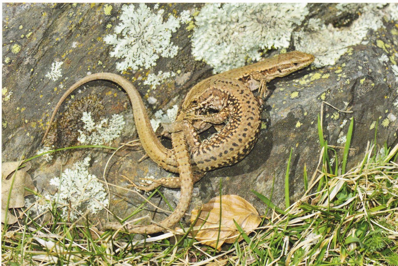
Figure 175: Podarcis muralis , femelle adulte en train d'ingérer un arthropode très volumineux (en haut). La scène a duré de longues minutes (Gajan, Ariège, 560 m, 2 septembre 2011). En bas: accouplement (Sentein, Ariège, 1050 m, 31 mars 2012).