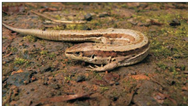
Рис. 1. Самка гирканской луговой ящерицы Fig. 1. A Darevskia praticola hyrcanica female

лабораторных условиях. Ящериц содержали группами из одной самки и двух самцов в полипропиленовых контейнерах размером 39×28×28 см (объем 22 л) марки Самла (ИКЕА, Россия) (рис. 3).