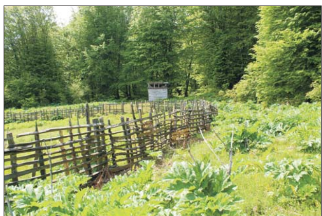
Рис. 2. Биотоп гирканской луговой ящерицы в урочище Гадазыгахи Fig. 2. Habitat of Darevskia praticola hyrcanica in the Gadazyghahi Natural Boundary

Живые корма (нимфы двупятнистого сверчка, Gryllus bimaculatus De Geer, 1773; личинки