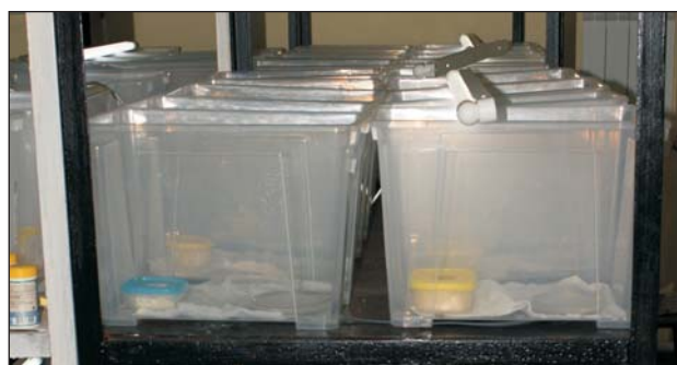
Рис. 3. Контейнеры для содержания гирканской луговой ящерицы в лаборатории Fig. 3. Containers for the laboratory keeping of Darevskia praticola hyrcanica

В предыдущей работе (Кидов и др., 2011) все кладки луговых ящериц этого подвида приходились на II (3 кладки) – III (1 кладка) декады мая, что, вероятно, обусловлено температурными условиями разных лет исследований.